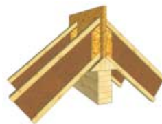
Spoj na vrcholové vaznici