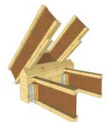
Přesah střechy s úhlovou podložkou