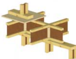
Nosné vnitřní stěny