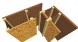
Rohový spoj – skeletová konstrukce