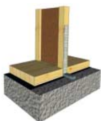
Spojovací element – dolní konec sloupku

M.T.A. spol. s r.o. Pod Pekárkami 7 190 00 Praha 9 tel. +420 724 115 627 tel. +420 283 893 426 e-mail: cabrada@mta.cz