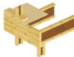
Zakončení stropu s bočním nosníkem