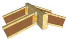
Spoj na vrcholové vaznici – ocelovými spojkami