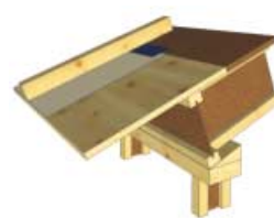
Přesah střechy s I-nosníkem zasazeným šikmo do pozednice